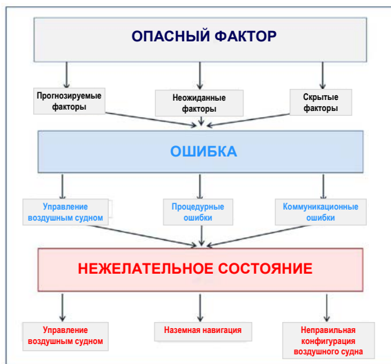
Рис. 3. Модель управления опасными факторами и ошибками (ТЕМ)

На рис. 3 показаны опасные факторы и ошибки, которые встречаются в повседневных авиационных операциях и требуют управления летными экипажами, поскольку как опасные факторы, так и ошибки потенциально способны создавать нежелательные состояния воздушных судов. При возникновении нежелательного состояния в равной степени важно управлять им, поскольку это последняя возможность для летного экипажа гарантировать безопасный результат выполнения авиационных операций.