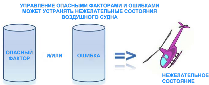
Рис. 1. Нежелательные состояния воздушного судна

«Управление» в контексте ТЕМ определяется как «планирование, руководство и контроль операции или ситуации». В практическом плане это означает своевременное определение опасных факторов и/или ошибок, которые могут приводить к нежелательным состояниям воздушного судна, и реагирование на них.