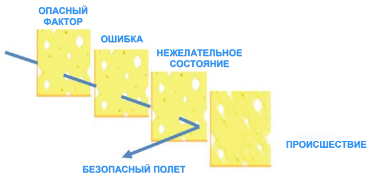
Рис. 5. От опасного фактора к безопасности полетов